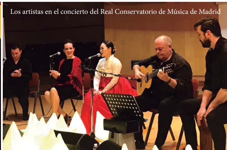
Los artistas en el concierto del Real Conservatorio de Música de Madrid